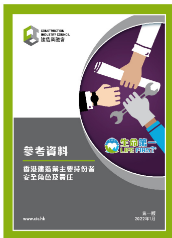
參考資料 — 香港建造業主要持份者 安全角色及責任