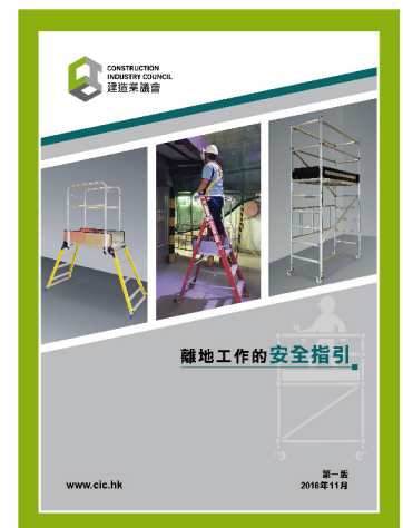
離地工作的安全指引