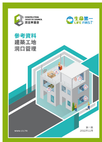
參考資料 — 建築工地洞口管理